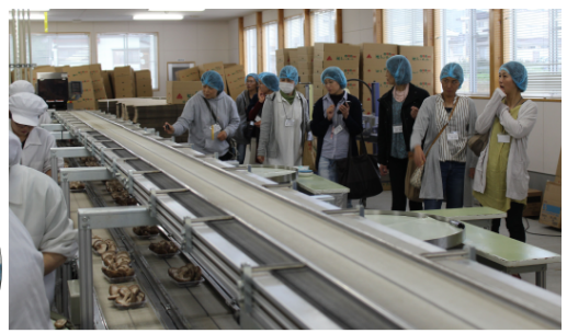
(③しいたけの選果場)