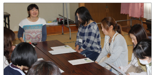
(①フレミズさんが働く法人で説明を受ける部員さん)

なんて生き活きと輝いている方ばかりなんだろう！と、ぷすぷすと不完全燃焼で燻らせている自分もったいなくて悔しくなる程の1日過ごしました。