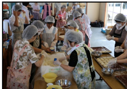
(当日おにぎりを作る様子)