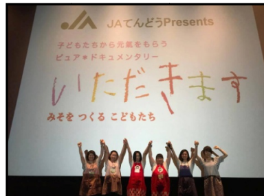
(スクリーンの前で記念撮影)